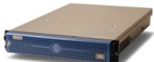
Ingrian i321 DataSecure Appliance