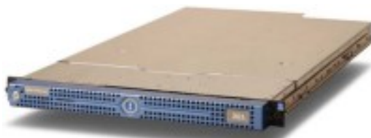
Ingrian i311 DataSecure Appliance

< 69 dBa im Normalbetrieb bei 20° Umgebungstemperatur